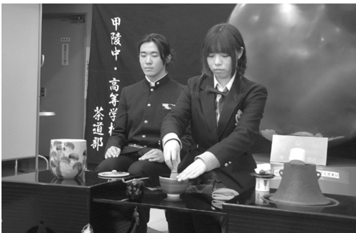
金田一春彦記念図書館で、来館者にお点前を披露する甲陵高校茶道部の生徒たち

りバレーボールに打ち込みたい生徒たちの受け皿になるうと考えたのがクラブチーム設立のきっかけで、現在は、北杜市や韮崎市、長野県などの中学校から1・3年生の約20人が参加している。練習の拠点は、帝京第