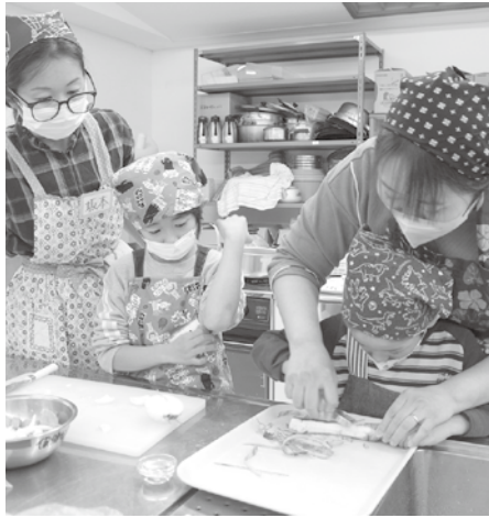
市内で生産された有機農産物を使って3つのレシピに挑戦する親子たち