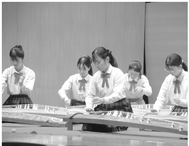
新年互礼会のオープニングアクトを務めた甲陵高校箏曲部の生徒たち

への決意を新たにした。当日は、市立甲陵高等学校箏曲部による華やかな演奏でスタート。同校箏曲部は、昨年10月に行われた「山梨県高等学校芸術文化祭」の日本音楽部門で、創部以来初となる最高賞の芸術文化祭を受賞しており、10人の生徒たちが息のあった演奏で聴衆を魅了した。