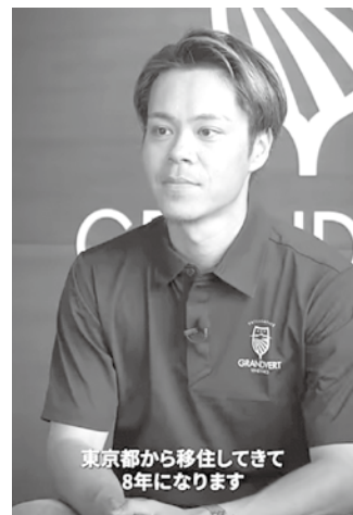
北杜市が作成した移住定住促進のための動画

若者の暮らしを紹介する移住定住促進のためのプロモーション動画を作成した。「自分らしい暮らしを実現できる場所」として若者に選ばれる地域を目指す、北杜市はこのほど、U・イーターンなどで市内の企業に新卒で就職した