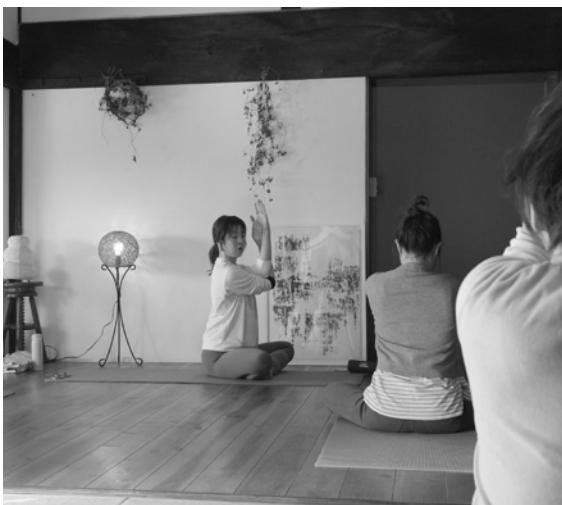
ゆっくりとした流れでポーズを取る様子

1月4日に開かれたスクールには5人の生徒が参加。「呼吸を意識しながら、新しい空気を吸い入れ、古い物(空気を)すべて吐き出すように」とレッスンを始まり、上半身の凝りをほぐしながら血流を意識することやうつ伏せの状態から背骨を伸ばすポーズ、股関節を広げる動作などを指導。小休止を入れて、体をゆっくりと左右にひねるポーズや片足を軸足にしてバランスを取るポーズなど、ゆっくりと無理をしない姿勢で指導した。問い合わせは☎080・5680・2167(奥水)まで。