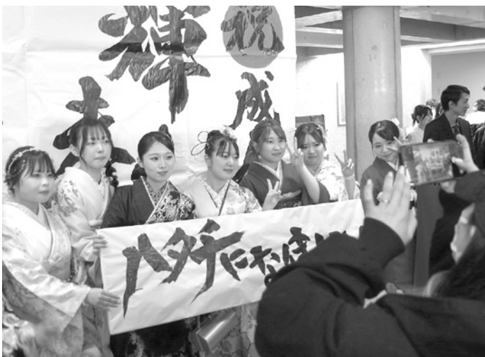
成人式の会場で記念写真の撮影を楽しむ若者たち

若者たちの門出を祝う「2026年北杜市成人式」が1月11日、高根町の八ヶ岳やまびこホールで開かれた。会場では、艶やかな振り袖や袴、スーツに身を包んだ若者たちが旧友との再会を喜び合い、写真撮影や思い出話に花を咲かせていた。