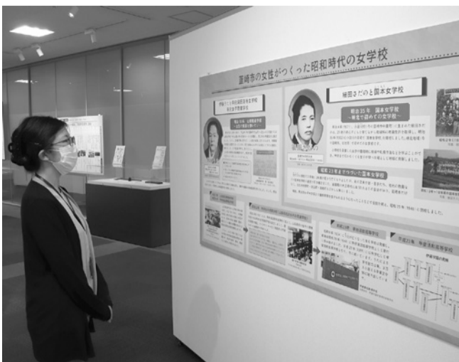
偉人資料館で行われている昭和100年の「教育・文化編」

「先人の偉業、パネル紹介」の第2弾「教育・文化編」が、このほど始まった。会期は来年3月22日まで。