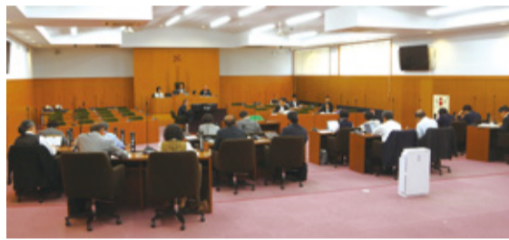
市立中学校(甲陵中を除く)8校を2校に統合する計画を巡り、北杜市議会が設置した「統合中学校にかかる特別委員会」の第2回会合が、5月25日に開かれた。

この特別委員会は、昨年12月に統合中学校の新たな学区や学校設置場所の候補地が示され、新年度予算に関連事業費が盛