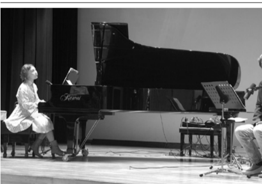
朗読と音楽のライブイベントの様子