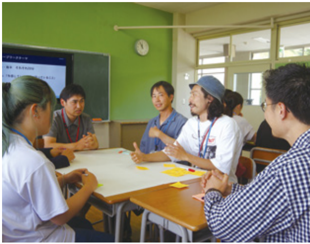
グループディスカッションで困り事や取り組みたいことを話し合う任期1年目の隊員たち

山梨県内で活動する「新人研修会」が5月19日(旧高根清里小学校)で開かれ、県内各地から任期1年目で20代、60代の隊員約20人が参加した。講義や事例発表を通して活動への理解を深め、隊員同士が交流した。この地域おこし協力隊