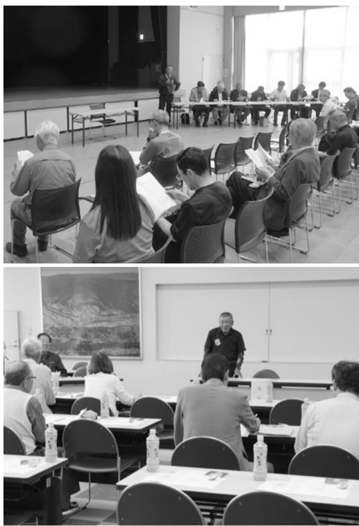
南アルプス地域連絡会の総会(上)と甲武信地域連絡会の総会(下)

南アルプスユネスコエコパークと甲武信ユネスコエコパークの2つのエコパークを有する北杜市で、5月に両エコパークの北杜市地域連絡会総会が開かれ、2025年度の事業報告と決算、26年度事業計画案の予算案などをそれぞれ承認した。